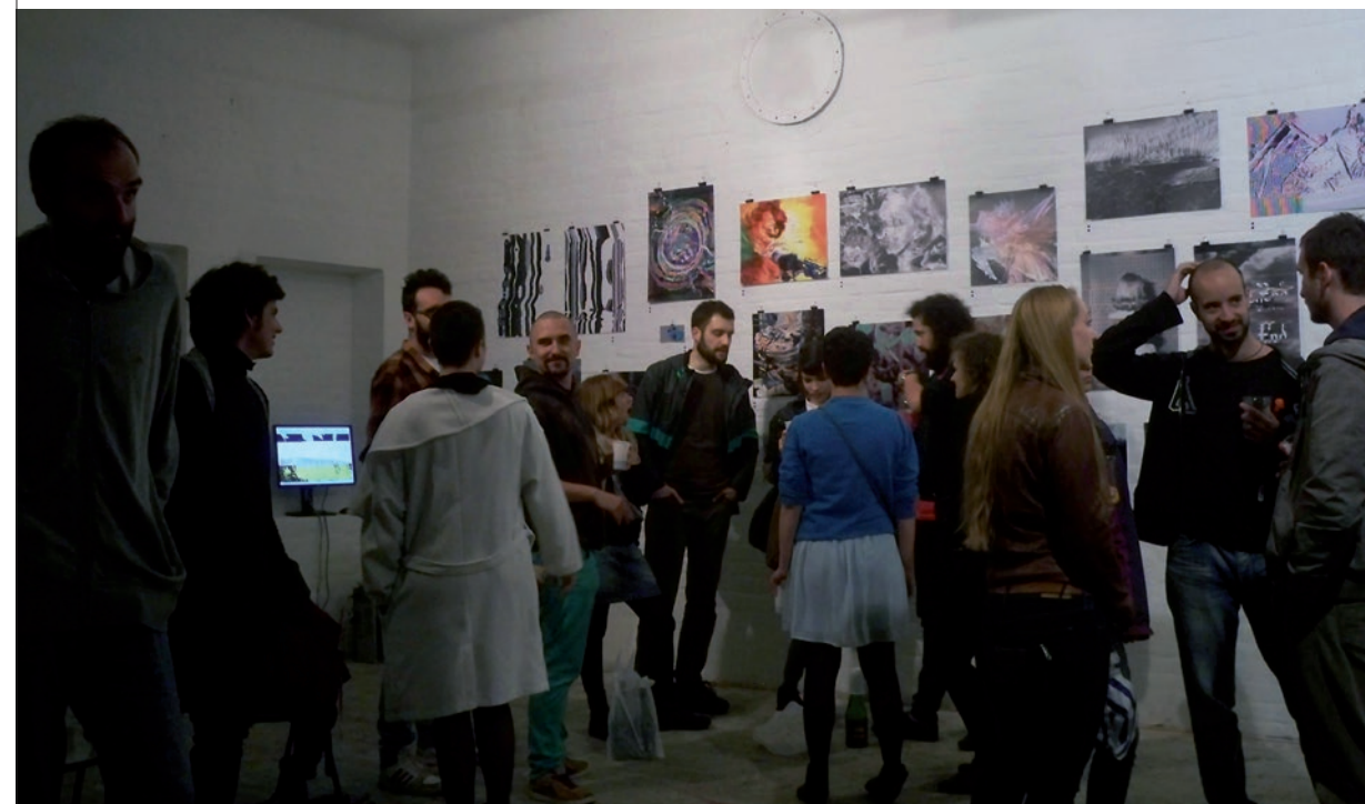
/fu:bar/ [Festival]. Siva Galerija, Zagreb, 2015.

Dok za neke umjetnike_ce greška proizlazi iz koda i odražava slom medija, drugi preskaču taj proces i bave se isključivo konačnom estetikom do koje dolaze uz pomoć softvera ili aplikacije. Bez obzira na to je li riječ o kritičkom ili estetiziranom pristupu, uključujuća narav samog festivala