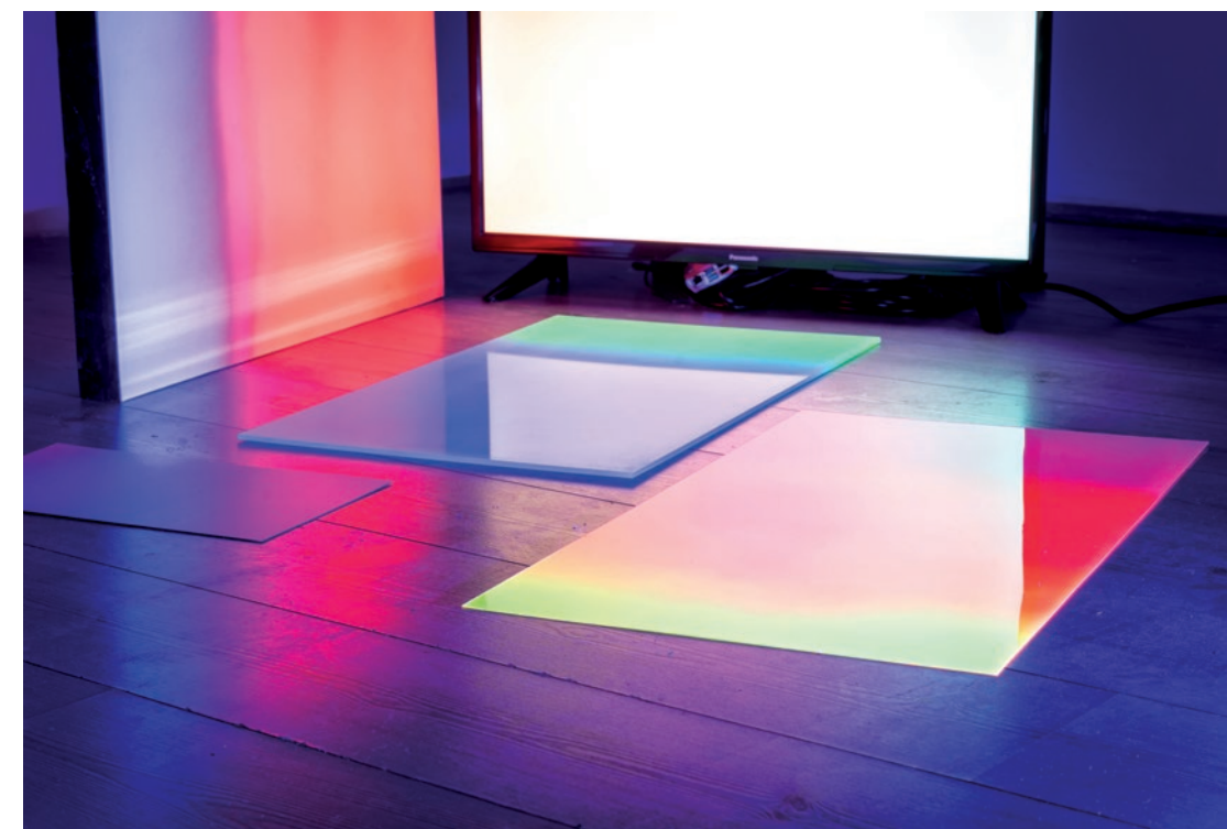
(prethodna i ova stranica) Giba, M. (2024). Prisutnost [Prostorna instalacija, proširena stvarnost]. DKC Lamparna, 2024.