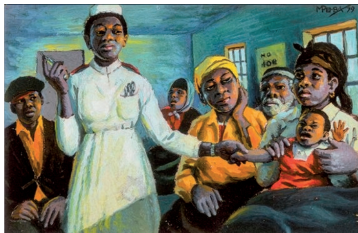
Pemba, G. (1979.) U klinici [Izložba When We See Us – A Century of Black Figuration in Painting , detalj]. Centar za likovne umjetnosti BOZAR, Bruxelles, 2025.